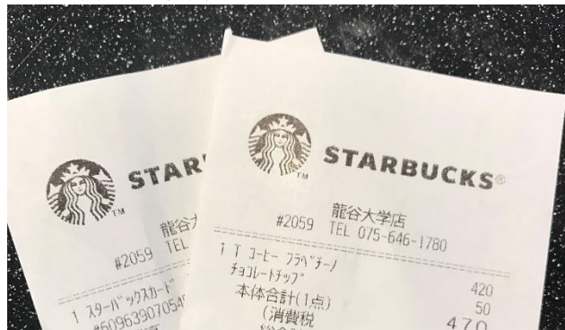
深草学舎の現在、顕真館と右側の図書館などがある和顔館、敷地内にはスターバックスもあります。