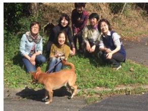
陶芸体験&ランチ親睦会