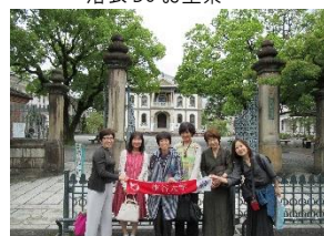
日帰り京都弾丸ツアー