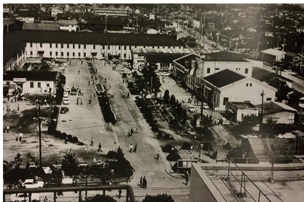
1968(昭和 43)年頃の深草学舎

コロナ禍により昨年度の当支部活動のほとんどが中止、その結果、ご報告がほとんどできなくなりましたので、代わりに今号では、変化し続ける母校の様子をお伝えいたします。