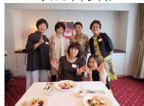
コーチング&質問カフェ