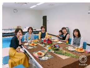
アロマキャンドル