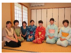
浴衣 De お呈茶