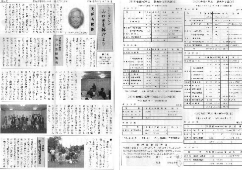
初の試みとなった「校友会たより」上での総会(第5号)

当初の計画では、北部(萩・長門)地区の引き受けて二〇二〇(令和2)年度総会の開催を予定していましたが、新型コロナウイルスの感染拡大により4・5月には全国的に緊急事態宣言がなされていたことから、残念ながら同一の場所に集合する形式での開催を断念せざるをえませんでした。理事会において