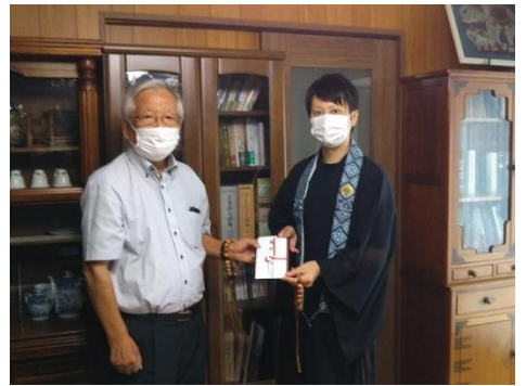
記念品贈呈の様子

の開催が新型コロナウイルス感染症の影響のため、例年に比べ大幅に遅れておりますが、当面は感染のリスクがありますためオンライン形式で総会を開催し、その際の記念講演として大來さんよりお話をいただく予定とされています。(詳しくは同封のご案内をご参照ください。)