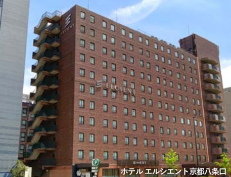
ホテルエルシエント京都八条口