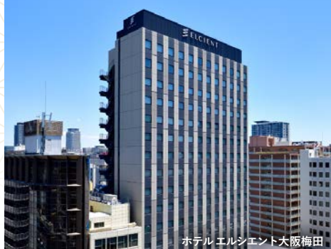
ホテルエルシエント大阪梅田