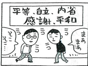
龍大紹介ページのカット

しかし、自分では気付かずとも、これも龍大で のお育てでしょうか（?）。卒業後ではあります が、お陰さまでいま浄土直宗の一カ寺の住職とし て、仏法に、真理に向かい 合つての日暮しを味わわせ ていただいています。 大学時代の思い出とも に、そんな思いも語り合え る校友会を築いていければ と思つております。