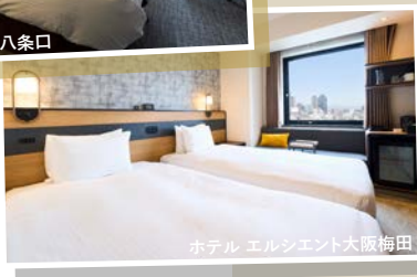
ホテル エルシエント大阪梅田