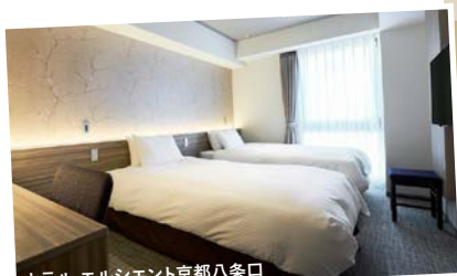
ホテル エルシエント京都八条口